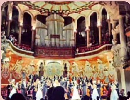
Стр. 4 ГАСТРОЛИ ТЕАТРА