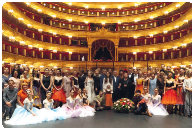
6 июля 2019 года. На Исторической сцене после показа балета «Эсмеральда»

Выступить на этой сцене — мечта любого артиста. Это и символ признания высокого профессионального уровня, и творческий успех, и огромная ответственность. В 2015 году Ростовский музыкальный первым из нестоличных театров был удостоен чести показать свои спектакли — оперу «Фауст» и балет «Драма на охоте» — на главной сцене страны. В 2019 году ростовчане привезли уже три спектакля — оперы «Хованщина» и «Жанна д'Арк» и балет «Эсмеральда». В нынешнем году ростовские артисты в третий раз отправятся покорять Историческую сцену Большого театра — взыскательная столичная публика увидит оперу «Турандот», балет «Золушка» и оперетту «Сильва». Гастроли пройдут с 23 по 28 июля благодаря поддержке Правительства Ростовской области.