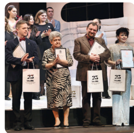
Награды получили сотрудники, проработавшие в театре все 25 лет