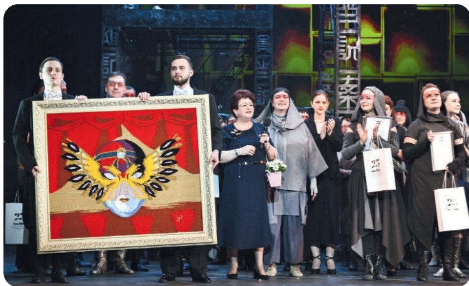
Гобелен, который артистки хора вышили вручную и подарили театру на своём бенефисе