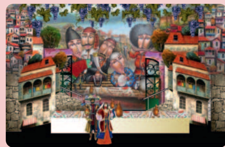
Декорации для водевиля «Ханума»