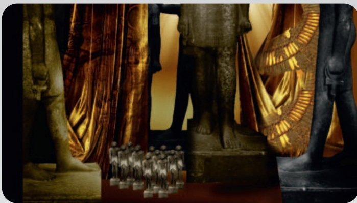
Эскизы декораций для постановки оперы в Ростовском музыкальном театре, созданные петербургским художником Сергеем Новиковым

И вновь борьба между добром и злом, любовью и ненавистью. И лигная драма, и классический любовный треугольник, и жгучая ревность, которая ослепляет и рушит человеческие жизни.