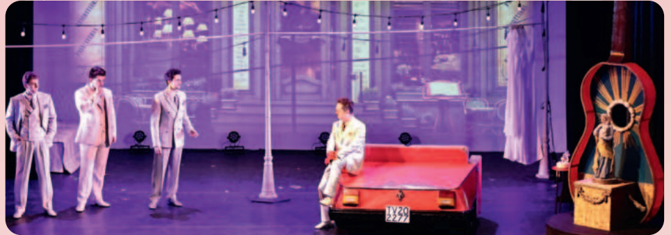
Декорации к мюзиклу «Брак по-итальянски»