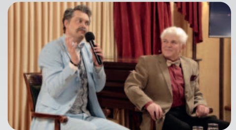
Гостями встреч «До первого звонка» становятся представители творческих профессий театра, в первую очередь артисты

• Упражнение: вдохните, выдохните, вздохните с облегчением, махните на неприятности рукой и примите душ. Выше голову, взгляд – победительный!