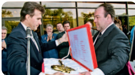
Торжественная церемония открытия театра

За годы работы в театре состоялись 154 премьеры спектаклей всех музыкальных жанров. Не осталось, пожалуй, ни одного всемирно известного композитора, чьи шедевры не украсили бы репертуарные афиши.