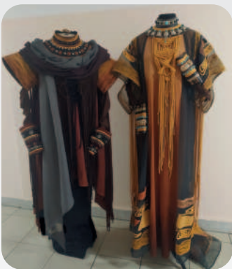
Для постановки будет сшито более двухсот костюмов. На каждом из них множество мелких деталей, которые пришиваются вручную

Опера «Аида» была написана Джузеппе Верди по заказу египетского хедива (вице-султана) Исмаила-паши для Каирского оперного театра, строительство которого было приурочено к открытию Суэцкого канала в 1869 году. Хедив заказал спектакль, который отражал бы историю Египта.