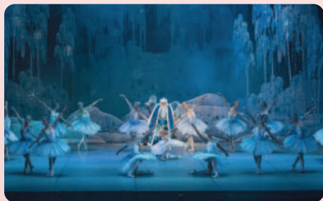
Оригинальное объёмное пространство в балете «Снегурочка» было создано благодаря 3D-декорациям

Родилась в г. Ростове-на-Дону. В школьные годы занималась в студии балета и хореографии и в музыкальной школе им. М.Ф. Гнесина по классу скрипки. Вопреки надеждам педагогов в музыкальное училище не пошла, а поступила на факультет журналистики РГУ (ныне ЮФУ), т.к. была внештатным корреспондентом газеты «Комсомолец» и членом Молодёжного совета ТЮЗа (ныне Молодёжный театр), чтобы через 3 года попытаться поступить во ВГИК на операторский факультет – это и было мечтой и большим желанием. Но через некоторое время забрала документы и отнесла их по соседству в РХУ им. М. Б. Грекова, в театрально-декорационное отделение оформительского (ныне факультет дизайна).