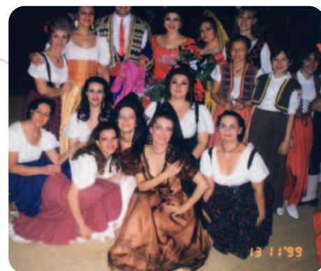
Артисты хора после премьеры оперы «Кармен»

Музыкальный театр регулярно радует своих зрителей многочисленными фестивалями и разнообразными концертными программами, бенефисами любимых артистов, их встречами со зрителями и автограф-